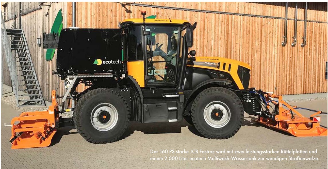
Der 160 PS starke JCB Fastrac wird mit zwei leistungsstarken Rüttelplatten und einem 2.000 Liter ecotech Multiwash-Wassertank zur wendigen Straßenwalze.

Lastwägen mit Ladegut, große und kleine Straßenwalzen, riesige Asphaltiermaschinen, eine Straßensperre und viele Bauarbeiter sind typische Bilder einer Straßen-Baustelle. Bei der Strabag, eines der größten Bauunternehmen Europas, ist ab sofort ein JCB Fastrac 4160 im Einsatz. Der 160 PS starke Traktor hat eine Vollfederung an Vorder- und Hinterachse, ein stufenloses Getriebe mit einer Endgeschwindigkeit von 60 km/h und einen Wendekreis von unter 10 Metern. Er ist mit zwei Plattenverdichtern und einem 2.000 Liter fassenden Wassertank ausgestattet, die ihn zu einer multifunktionalen Straßenbaumaschine werden lassen.